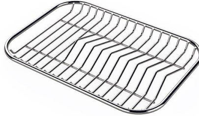
Rejilla portaplatos inox sólo se puede utilizar en combinación con los accesorios 8644 003 8100 154